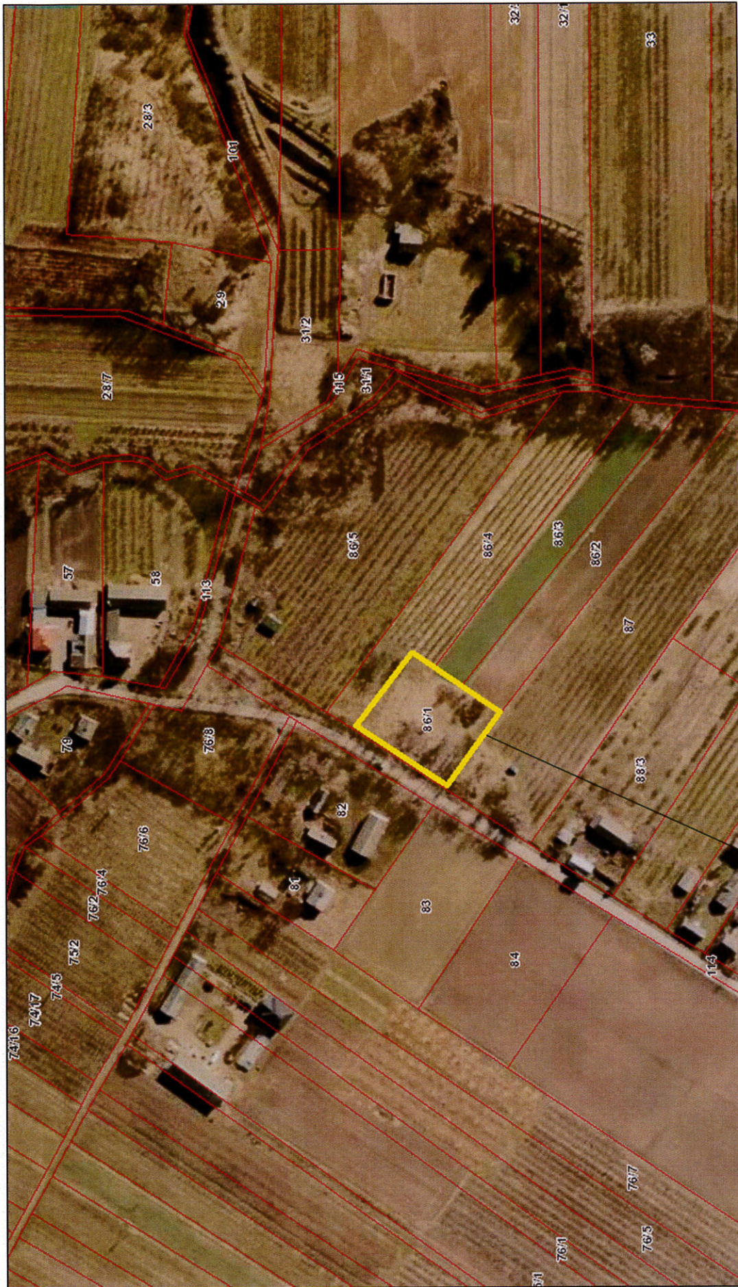
lokalizacja budynku świetlicy wiejskiej w miejscowości Jugoszów